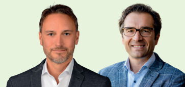
Alexander Mozer Alexander Funk Fondsaufgabe 2024

R-Tranche: WKN A3D3Y7 I-Tranche: WKN A3D3Y6 S-Tranche: WKN A3D3Y8 Artikel 8+ nach SFDR